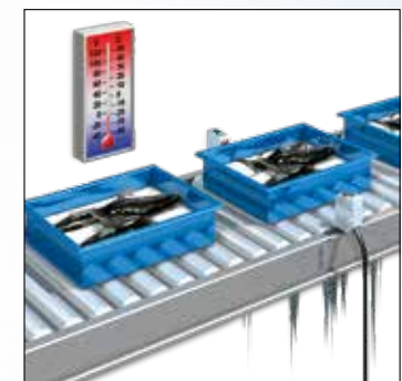
Жесткие условия эксплуатации