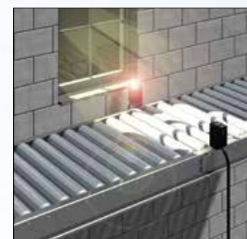
Высокая устойчивость к интенсивному внешнему освещению