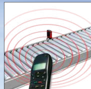
Устойчивость к электромагнитным помехам