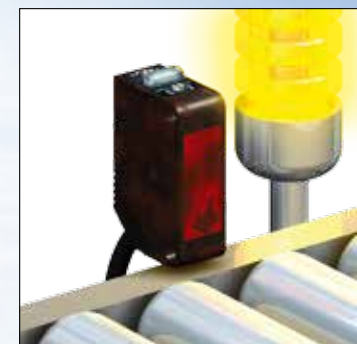
Контроль состояния датчика